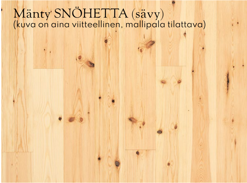
Mänty SNÖHETTA (sävy) (kuva on aina viitteellinen, mallipala tilattava)